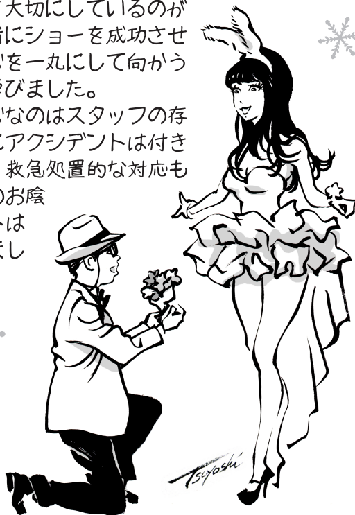
イラスト: 月与志 http://tsuyoshi-jp.com

とても人を大切にしているのが 伝わり一緒にショーを成功させる ために心を丸にして向かう 大切さを学びました。 そして肝心なのはスタッフの存 在。本番にアクシデントは付き ものです。救急処置的な対応も スタッフのお陰 でイベントは 進行出来ました。